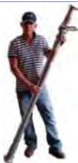
PUNTELLI CLASSE D

Puntelli realizzati con sistema antisfilamento, dispositivo anti schiacciamento della mano, sblocco rapido, filettatura esterna, diametro del tubo tra 70 e 76 mm.