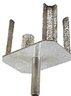
TESTA A FORCA

Testa a forca con una forma studiata appositamente per poter inserire, a seconda delle necessità, una o due travi, in base alla posizione di utilizzo.