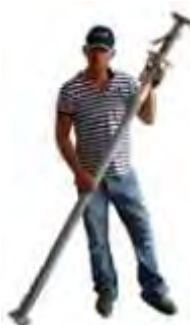
PUNTELLI CLASSE B

Puntelli realizzati con sistema antisfilamento, dispositivo anti schiacciamento della mano, sblocco rapido, filettatura esterna, diametro del tubo tra 60 e 70 mm.