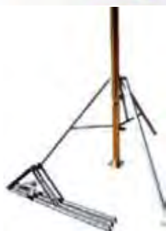
TREPIEDE PER PUNTELLO

Trepiede robusto studiato appositamente per reggere il puntello e il carico massimo ammissibile dato dalla somma del peso del solaio e del carico accidentale.