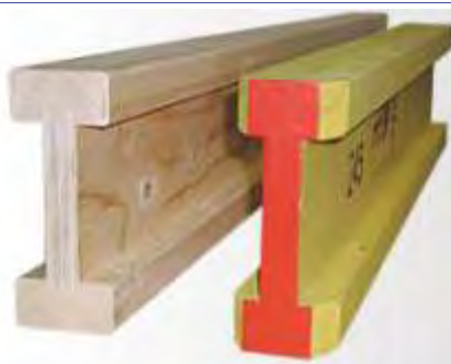
TRAVI IN LEGNO LAMELLARE

Travi realizzate in abete rosso nordico con una speciale nervatura appositamente realizzata, costituita da 9 strati di legno laminato impiallacciato per rendere il prodotto molto stabile.